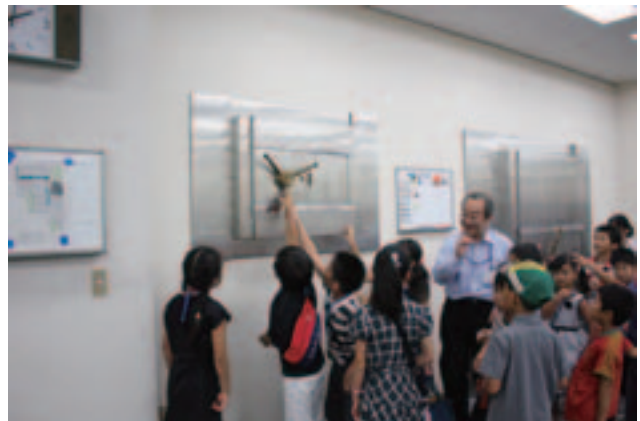
なかよしファミリーデー（家族の職場参観日）の様子