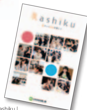
ロールモデル紹介冊子「Rashiku」